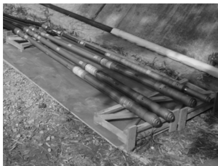
写真. 1 試験アンカー