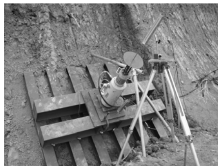
写真. 2 試験状況