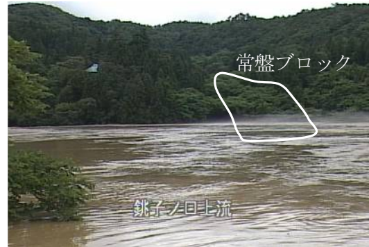
写真. 8 阿賀川増水後 (7. 30)