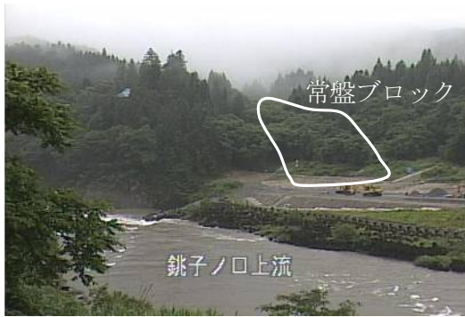
写真. 7 阿賀川増水前 (7. 28)