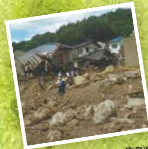
広島県安佐南区八木で発生した土砂災害