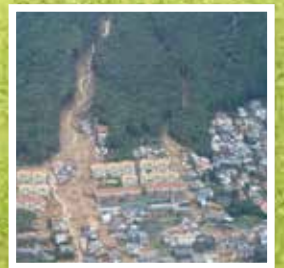
伊豆大島で発生した土石流災害