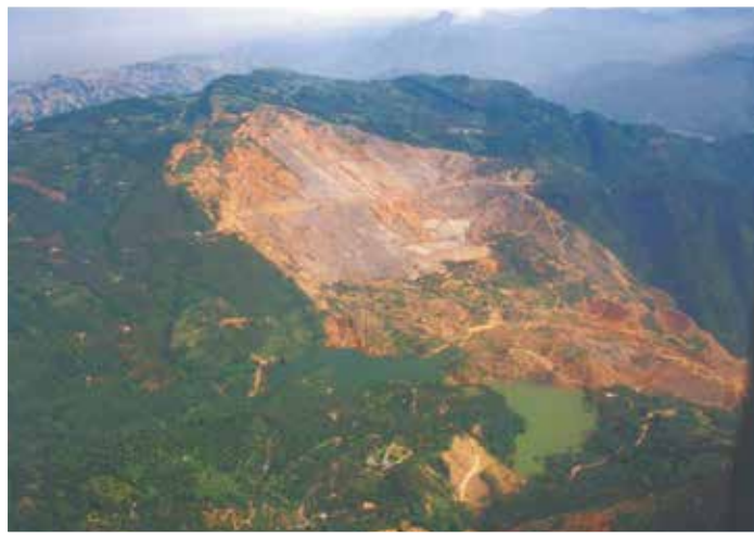
1999年 九份二山 台湾