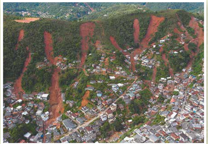
2011年 リオデシャネイロ ブラジル