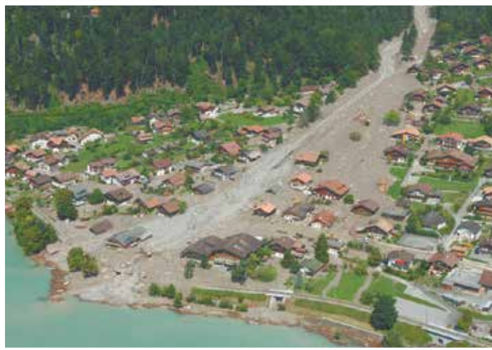
2005年 プリエント スイス