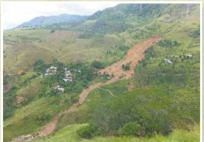
2014年 コスランダ スリランカ