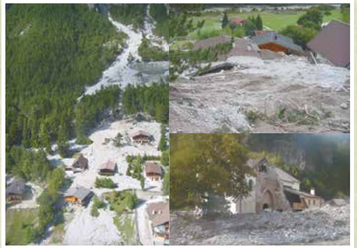
2003年 フェッラ川 イタリア