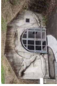
②1号排水トンネル (所要時間30分)