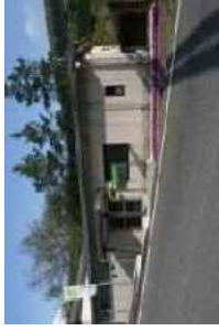
①亀の瀬地すべり歴史資料室 (所要時間30分)