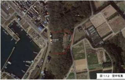
図 1.1.2 空中写真