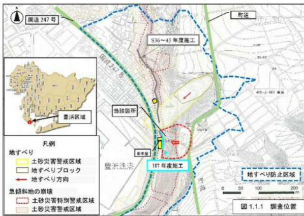
図 1.1.1 調査位置