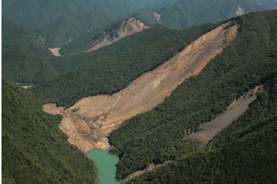
写真1 赤谷地区の河道閉塞（閉塞高 85m, 満水時容量 550 万 m 3 ）